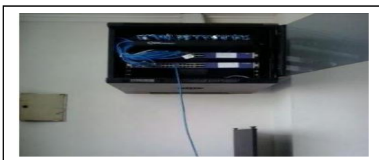
Gambar 1.Lokasi Switch Gedung Satrio Lantai 6

Jika suhu yang melebihi batas rekomendasi dari pabrikan dan dibiarkan tanpa tindak lanjut maka akan menyebabkan kerusakan pada switch seperti hang sehingga akan mengganggu proses pelayanan di rumah sakit dan availability jaringan sistem informasi manajemen rumah sakit akan rendah. Sebagai bahan tindak lanjut untuk mengurangi suhu pada switch, maka dapat ditempatkan rackmount fan seperti pada Gambar 3 dan penempatan switch pada rak diberikan ruang, sehingga sirkulasi udara pada rak baik.